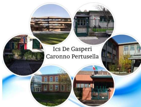
Ics De Gasperi Caronno Pertusella